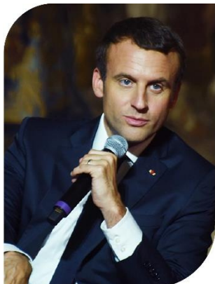
Emmanuel Macron Président de la République

Allez dans une classe avec un élève en situation de handicap. Au début de l'année, il y en a toujours pour se moquer. Que révèlent réellement ces railleries ? Elles sont le cri de faiblesse du groupe. Les enfants qui se moquent pensent déstabiliser celle ou celui qui ne leur ressemble pas, mais en réalité, c'est leur propre malaise qu'ils expriment face à ce qu'ils ne connaissent pas, leurs propres failles qu'ils mettent à jour. Ce peut être un mélange de peur, d'embarras, le sentiment de ne pas savoir comment parler de cette différence, comment agir face à l'autre.