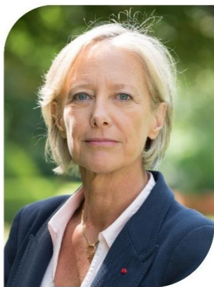
Sophie Cluzel Secrétaire d'État chargée des Personnes handicapées